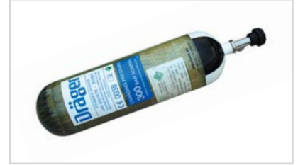
Karbon Fiber Kompozit Silindir 6,8 lt / 300 bar