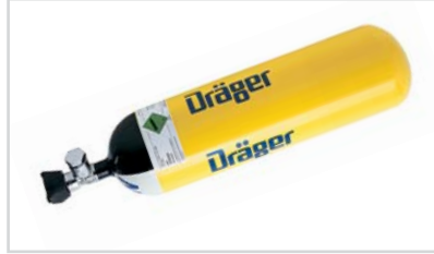
Çelik Silindir 6 lt / 300 bar

Denizcilik sektörü ve farklı pek çok endüstriyel sektördeki ihtiyaçlar göz önüne alınarak geliştirilen çelik silindirler, daha ekonomik bir seçenek olarak sunulmaktadır. Bu silindirler CE işaretli, 97/23 EC Basıncılı Ekipmanlar Direktifi'ne uygun, BS EN 1964-1:1999 ve EN 12245:2002 standartlarına uygundur.